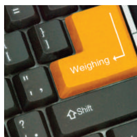
Logiciel de collecte de données