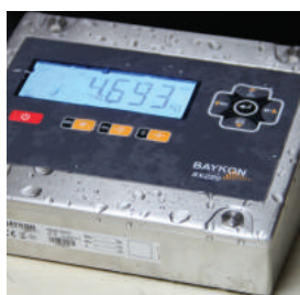
Divers types d'indicateurs