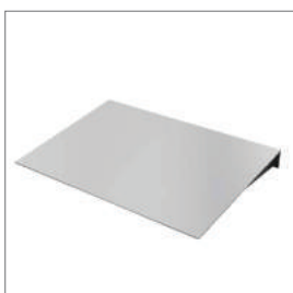
Rampes convenant à l'utilisation sur la surface