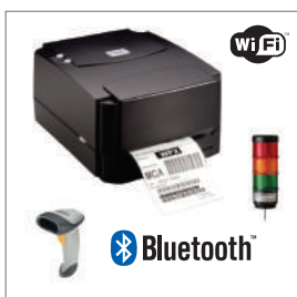
Connexion sans fil avec périphériques